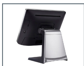
Acabado de aluminio